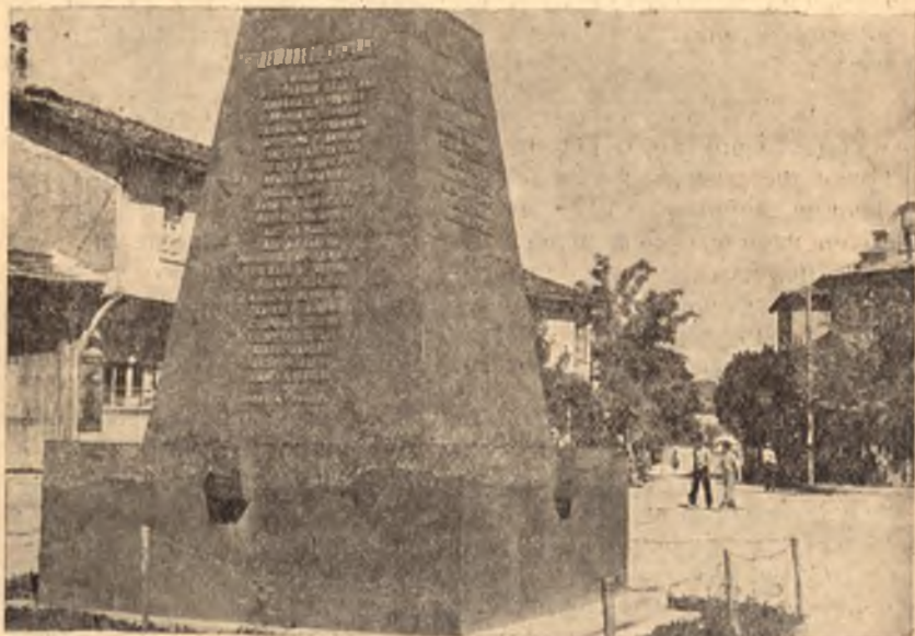
Партизанските паметници по българската и югославска земя са надгробни плочи на великобългарския и великосръбски шовинизъм, изпод които той никога не ще възкръсне