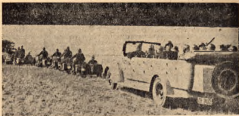
Пригответа за войната срещу съюзените народи българска войска, требваше да бъде хвърлена на вътрешния фронт... На снимката — войскава колона на път за преследване на партизаните

с нас, но дерзайте! Вие сам сте убеден в близкия край на фашистката тирания и на нашата пълна и безусловна победа.