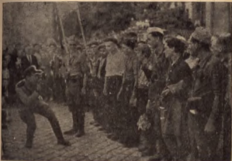
България беше откъсната — за размера и дейността на нашето партизанско движение светът узна едва след народната победа на 9 септември. На снимката — съветски офицер фотографира група партизани

гария, за съвместната им бойна дейност против германците и правителствените войски.