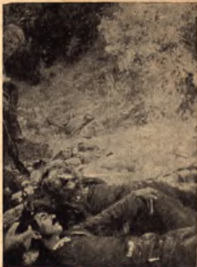
Полицаят наднича да свърже лика си със своето зловещо дело