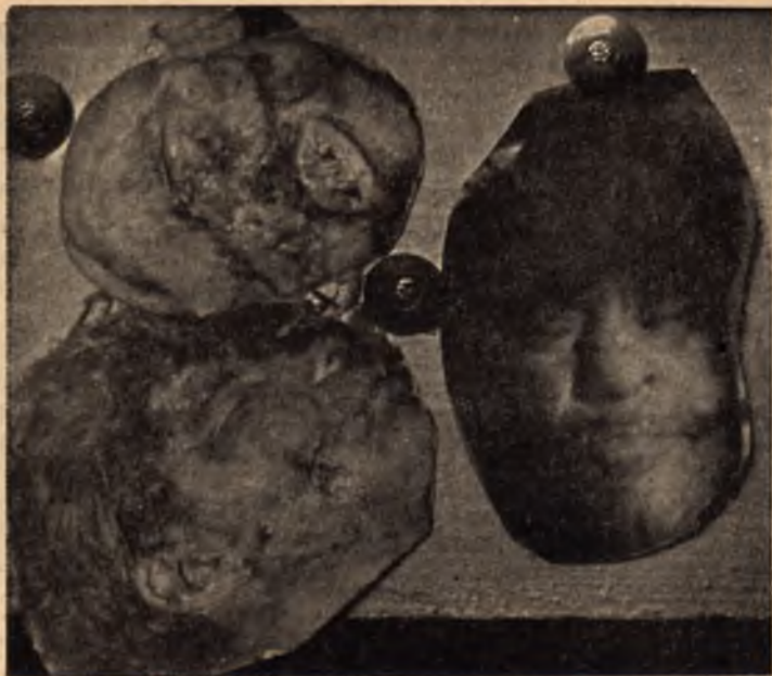
Свидетелство, че зловещите времена на фашизма няма да се върнат

вах ги на майка и ги заплаших, че същата участ очаква всеки, който поддържа партизаните.