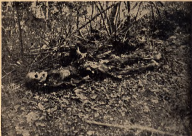
Разложен труп на убита въстаничка от отред „Антон Иванов“, намерен в местността „Младенови усойки,“ под баража „Въча“

прашат усилен офицерски и подофицерски патрули, както в Мургащ-планина, така и в всички съмнителни райони от Старопланина, Средна гора и Гълъбец-планина, за да се разузнае движението и местата, където се укриват разбойниците. Въз основа на добитите сведения при тези организирани разузнавателни вилазки, почти ежедневно се предприемаха локални акции с част от поделенията за прочистване на точно определени и съмнителни райони, а при по-положителни сведения за силата и местонахождението на разбойниците — и общи такива от всички части на отреда.