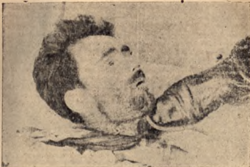
Лъснатият офицерски ботуш намества отрязаната глава на партизанина, за да стане снимката по-документална, та наградата да е по-сигурна

Друг метод за увеличането на войската бе развърщането ѝ чрез даването на ордени, повишения и значителни парични награди на убийците и золумджиите. Борбата срещу българския народ бе превърната в узаконен, покровителствуван и насърдаван грабеж, в средновековно мародерство и доходно занятие за лумпенизираните типове, за легионерите-фашисти, нехранимайковци и неволно поддадените жертви.