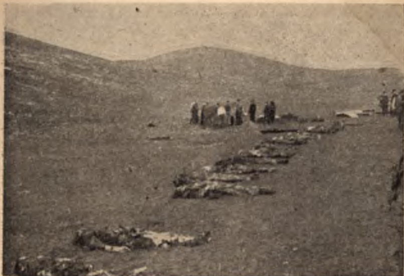
Жертвите край гр. Радомир, за които се разказва в следващите страници

обществените организации, според случая, като ръководството принадлежи най-напред на общинската власт, според това, коя от тях се намира на местото или близо до него;