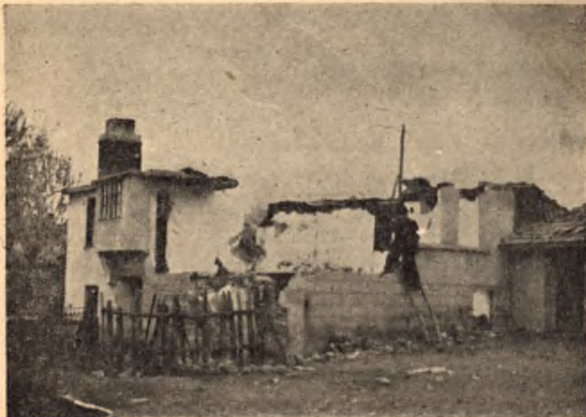
VI сливенска зона