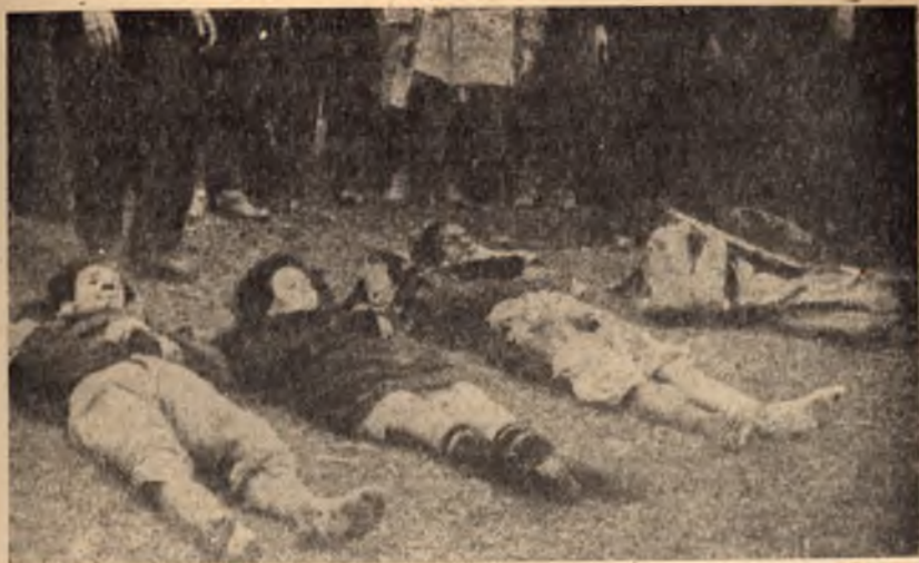
Палачите фотографираха жертвите си не заради документиране на жестоката правда, а за да получат паричните награди за всеки убит — по 50,000 лв.

фашистки правителства и на техните сподвижници да се припишат на българския народ.