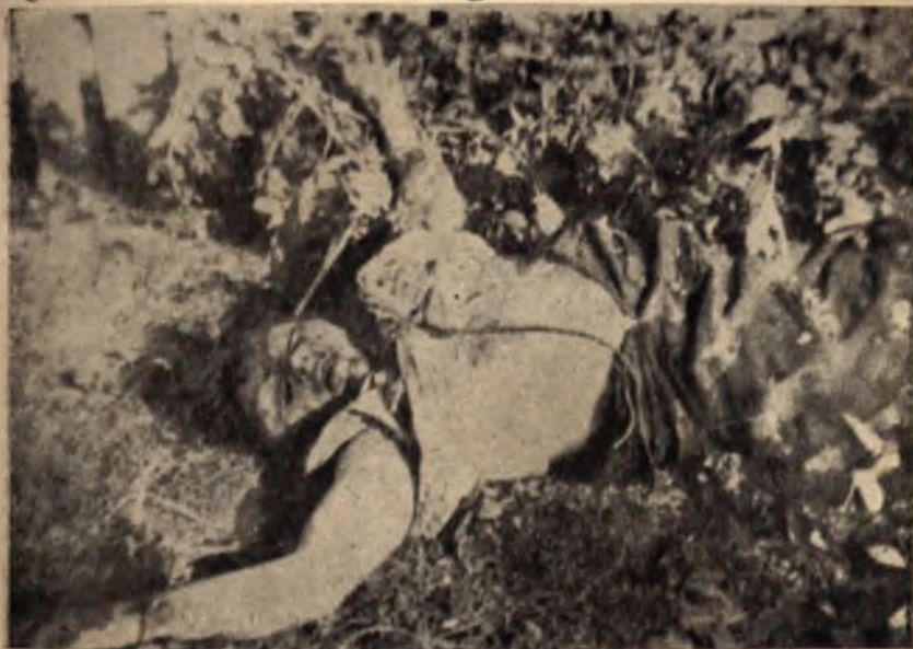
Убитя въстаничя от Свищов

се помни златното правило: най-добрата охрана е разузнаването, но най-доброто разузнаване е боят.