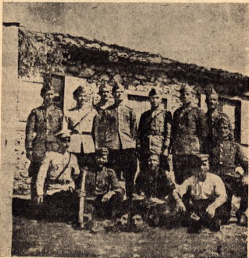
Съпротивителното движение спаси честта на българската армия, като я измъкна от лапите на професионалните убийци от рода на ген. Кочо Стоянов и на ония, които се фотографираха с брадвите и отрязаните глави

Борбата на народните синове за спасяването на армията, за издръпването ѝ от ръцете на престъпниците и за превръщането ѝ в противохитлеристка сила, въпреки скъпите жертви,