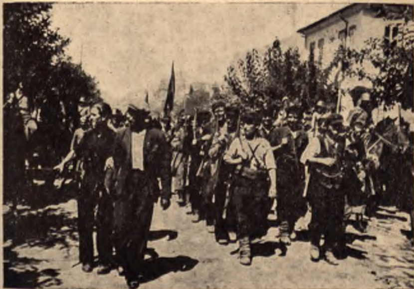
Българските партизани години наред очакваха да получат по-добро въоръжение от съюзниците

б) Копринена: копринената индустрия е от най-голямо значение . Годишното производство на сурова коприна възлиза на около 300—400 тона. Има около 40 тъкачни и 12 предачни фабрики. Копринените фабрики в Карлово и Казанлък са ангажирани само с производството на парашути.