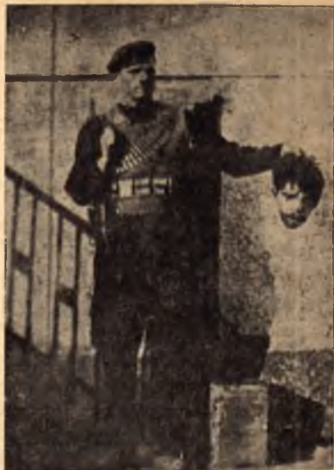
Фотографиран с главата на своя брат

М-во на Вътрешните работи и Нар. Здраве № 86 17 юни 1944 г.