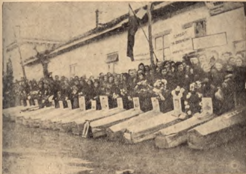
Не за Хитлер и цар Борис, а в борба срещу фашизма слагаха костите си българските синове. И тяхната жертва бе принос за победата на съюзниците