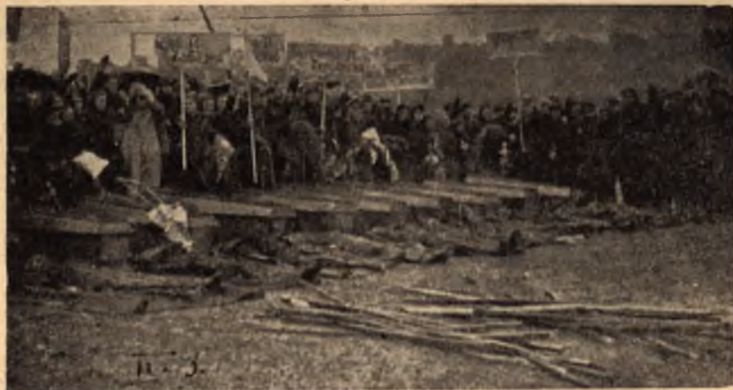
Народът след 9 септември сбра в братски гробници костите на своите синове-герои