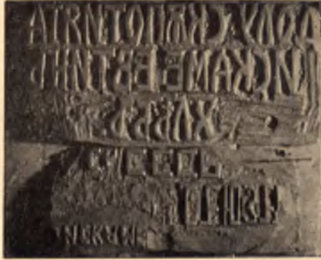
Печат за лозунги срещу сѣлпотията

От изложените случаи, както и от донесенията за други такива, се вижда, че въпреки наказанията в правилниците и даваните от делни разпореждания за начина на действие при провеждането на акции за прочистване или за охрана на важни обекти в страната, разузнаването е било слабо, или никак не е разузнавано, като последица от което се е дохождало винаги до унищожаване или обезоръжаване и отвлечане на изненаданите подразделения.