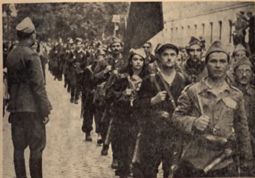
Марш и слабо въоръжени, българските партизани приковаха фашистните войски, както и четири германски дивизии. На снимката: завръщането на героите от бригада „Чавдар“