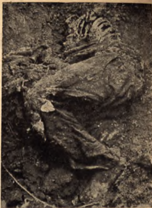
Кучетата глождеха трупове на народните герои