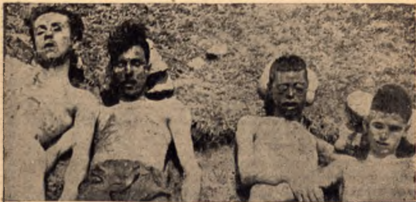
Паднали в сражението при село Батулия партизани. Крайният отлево е

През м. март 1944 год. бях задължен да се явя на служба в жандармерията в София. От 1 март до 26 април с. г. дружината беше в София, и на 26 април за пръв път излезохме в акция. През време на акциите съм срещал из полето овчари, овчарчета и воловарчета. Бях научил войниците си да упражняват тормоз над населението, за да се сплаши и да не смее да помага на партизаните, поради което войниците ми