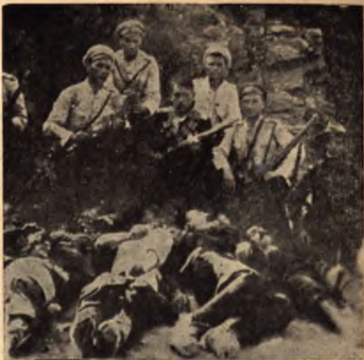
Ловната глутница е доволна от своя лов

Масата на българските войници и офицери, както вече обширно разкрихме, оставаше дълбоко погнушена от престъпленията на шепата предатели, които действуваха от името на всички и петнеха всички. Верно е, че това беше един постепенно нарастващ процес, че самата военна машина, мрежата от предатели и шпиони и терорът в казармите позволяваха възмущението да се изрази в открита акция, само когато такава акция можеше грижливо да се организира, за да разкъса обръча, както е при конспирациите, единичните и групови