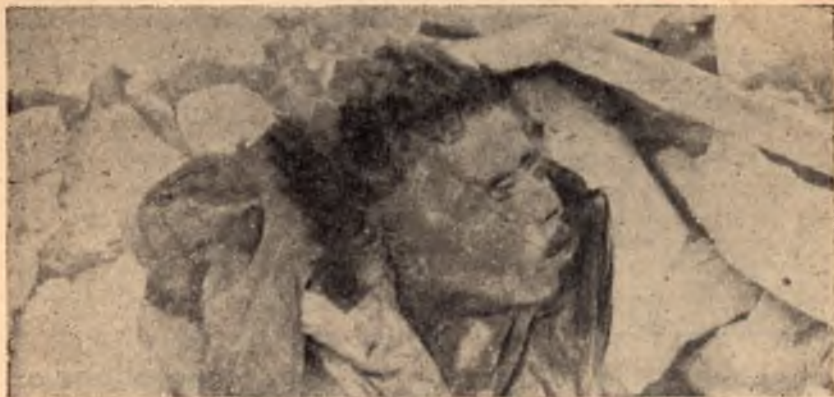
Затрупан с камъни неизвестен въстаник

и) На 1 юни т. г. една разбойническа група от около 25—30 души е нападнала кошарите на село Батулия, софийско.