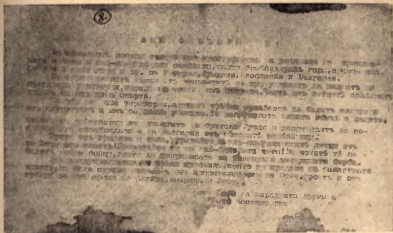
Оригиналното нареждане на дружина „Кочо Честименски“ за спасяване на падналите англо-американски летци

лета, когато партизани и народ гледаха с възторг летежа на стоманените птици, които заедно с смъртта ръсеха и надеждата, че е близък вече краят на фашисткия гнет.