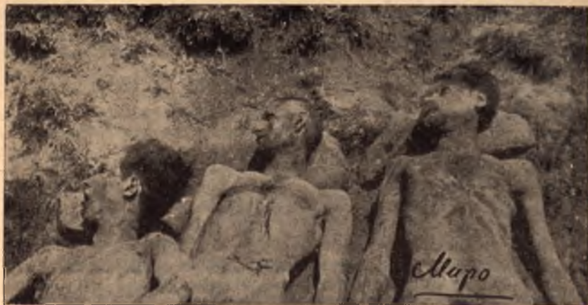
Част от загиналите и избити въстаници в сражението при с. Батулия, ссфийско