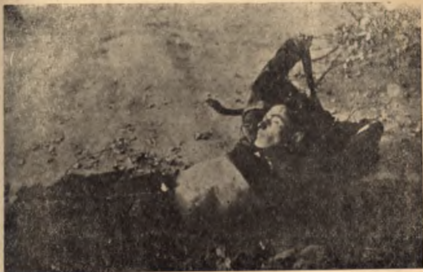
Не само за каузата на България, но и за общата съюзническа победа загиваха нашите храбри момци. Снимката е на неизвестен партизанин

съдбата на кап. Томпсон е известна — загина редом с българските си другари след сражението при с. Батулия.)