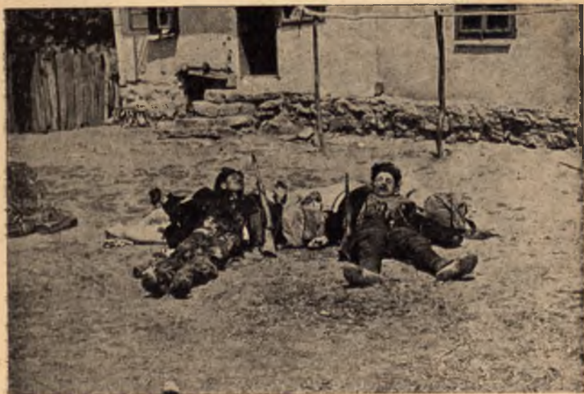
XII в. о. зона