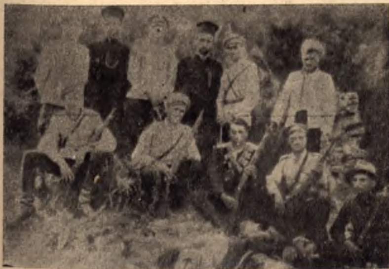
Българският народ няма нищо общо със убийците, които изстребваха най-благородните му синове и дъщери.

Общо взето, състоянието в армията бе сходно с общото състояние в България, защото бе и негово естествено отражение: от една страна бе произхождащата от народа и затова здраво свързана с неговите интереси и разбирания войнишка маса, настроена зле към германците и техните агенти, по спомен още от Първата световна война, която беше взела толкова