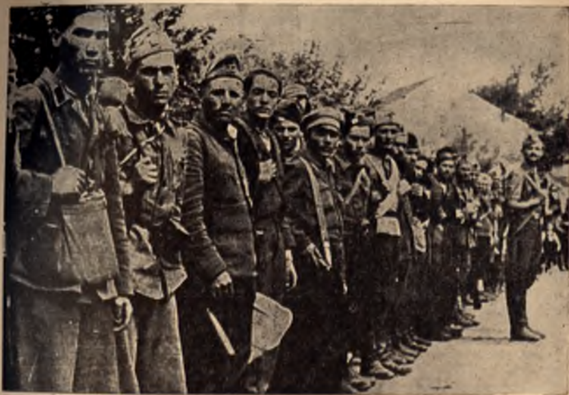
Българските партизани намираха закрила в земите на братска Югославия. Там те печелеха опит, въоръжаваха се и се връщаха за нови боеве

Една от проявите на българо-югославското сътрудничество през време на борбата срещу фашизма, през време на войната бе голямата пропагандна и печатна дейност, развита от българското съпротивително движение сред нашата армия, особено сред частите от окупационния корпус в Югославия. В нелегалните печатници на Работническата партия се издаваха в голям тираж много позиви, които се разпращаха на адресите на мобилизираните войници и офицери, пръскаха се в района на казармите и лагерите, както и по пътищата, през които се движеха войските. Тези позиви се подхващаха, преписваха и наново разпространяваха според дадените указания.