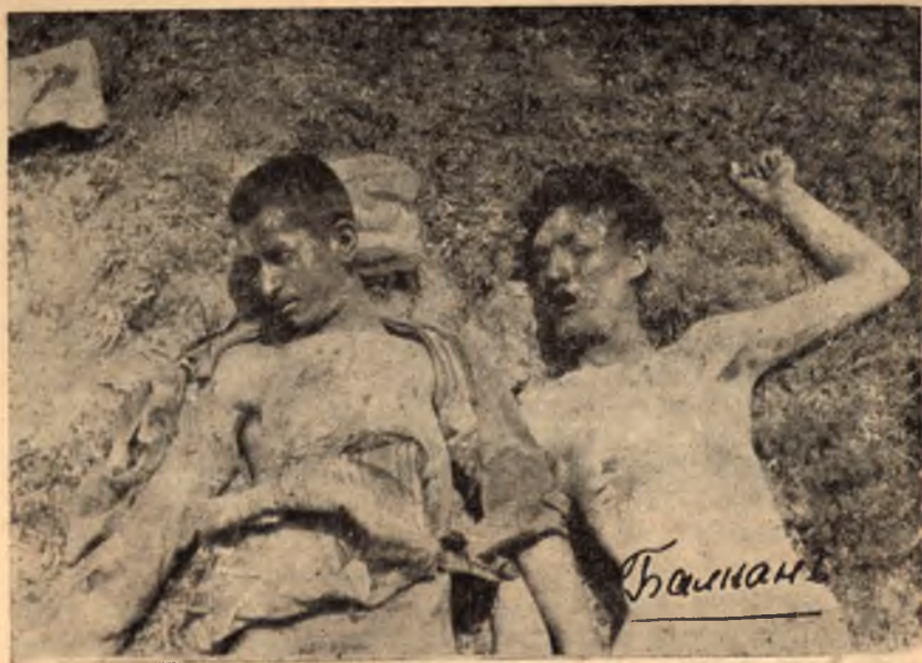
Още двама от дългата вереница на падналите герои

щата“. Спомням си за убийството на детето, което казваше на к-на, че майка му е болна, и то е ходило в Брестовица, за да купи церове.“