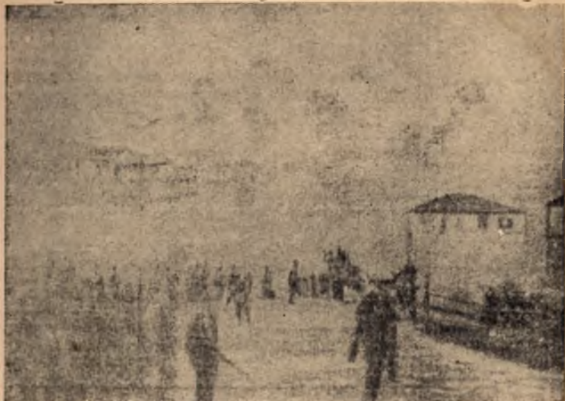
Жандармеристите изпълняваха заповедите на своите командири, паляха селищата и пазеха да не би нещо да бъде спасено от пожарицето

План на действие: поменатият район се обгражда с три охранителни линии: северна, южна и източна. За претърсване на района се назначават три претърсващи групи: полковник Чалъков, майор Гошев и полковник Димитров. Претърсването се извършва на три етапа: първия ден—достигане линията Горно-Градище—в. Мечита—село Сулица—село Лесково, на втория ден — достигане шосето Горно-Паничеревските бани—гр. Стара-Загора; на третия ден — повторно претърсване на източната част на района.