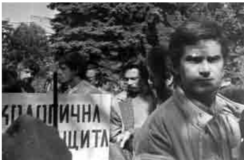
Първи ден на подписката в градинката между сладкарница „Кристал“ и Централния дом на армията. Отдясно наляво са – Волен Сидеров, Георги Аврамов, гражданин, Александър Каракачанов.