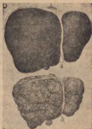
Черен дроб: а) нормален, б) на алкохолик (чернодр. цирроза)

други органи на човешката физическа и духовна машина, да храни тялото с кръв и да поддържа живота. Но ето, че вкараният в стомаха и червата алкохол минава в кръвта и сърцето е принудено да удвои и одесетори силата, за да изхвърли и обезвреди отровата. Пиящите имат големи, но слаби сърца. Мускулните влакна, с помоща на които сърцето изтласква кръвта, с течение на времето се затрудняват от излишните тлъстини и сърцето работи отначало неправилно. За да се справи с голямото количество течности, сърцето работи пресилено,