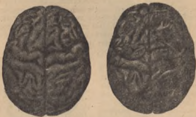
Мозъци: I) на здрав човек и II) на алкохолнк — с израждане на мозъчните гънки.

мисленето. Пияният извършва глупави, смешни и отвратителни дела, от които в трезво състояние се срамува. Действието на сп. отрова върху мозъка