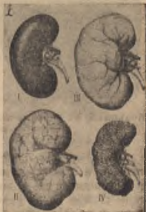
Бъбреци: I) Здрав, II) подут и възпален от алкохолната злоупотреба; бъбречна болест. III. Затлъстял, IV. Свит, набръчкан, повреден.

Най-чувствителни са, обаче, нервните и мозъчните клетки. До тях отровата достига най-напред по кръвоносните съдове. Пиящият губи разум и съзнание за вършената от него дейност и това е първият признак, че алкохолът е стигнал до мозъка и е разстроил най-вишата човешка дейност—