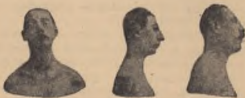
Отровено наследство — деца на пияници

Пиящият не вреди само на себе си. Човекът е социално същество, той принадлежи на семейството, на обществото и на държавата, за които той работи и от които очаква да му осигурят по-добър живот. А ние твърдим и никой не ни оспорва, че пиящият е асоциален тип човек. Неговите действия, неговата работа и неговото бездействие с нищо не подпомагат социалния организъм.