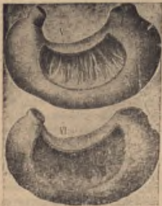
Стомах на здрав човек и стомах на алкохолик (с възпаление на лигавицата и язва)

машните жлези изпускат сок-пепсин, който разлага храните и улеснява храносмилането. Ракията преси-