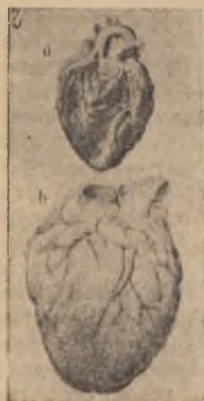
Нормално и „бирено“ сърце

е огромна. От раждането до смърта сърцето има тая задача — да развива сила в полза на всичките